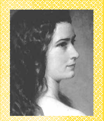
Kaiserin Elisabeth (1837 - 1898)

Auf Spurensuche zwischen den Gärten von Schloss Trauttmansdorff und dem Herzen der Kurstadt Meran